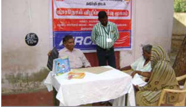
18.12.2016 அன்று 10,000-க்கும் மேற்பட்ட பொது மக்களுக்கு காசநோய் கண்டறியும் முகாம்