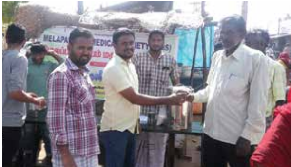
15.08.2017 அன்று ஏறத்தாழ 12,000 பேருக்கு நிலவோம்பு கசாயம் விநியோகம்