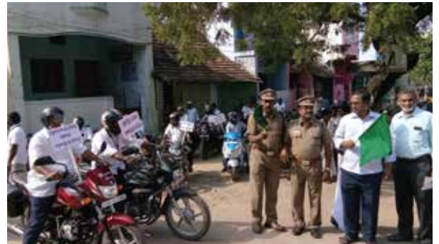
23.12.2017 அன்று இரு சக்கர வாகன சாலை பாதுகாப்பு விழிப்புணர்வு பேரணி